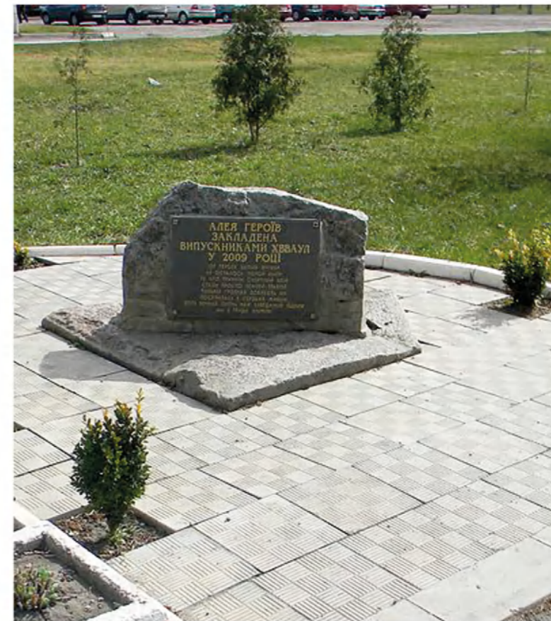
➤ Плита установлена в городе Чугуеве Харьковской области (Украина).