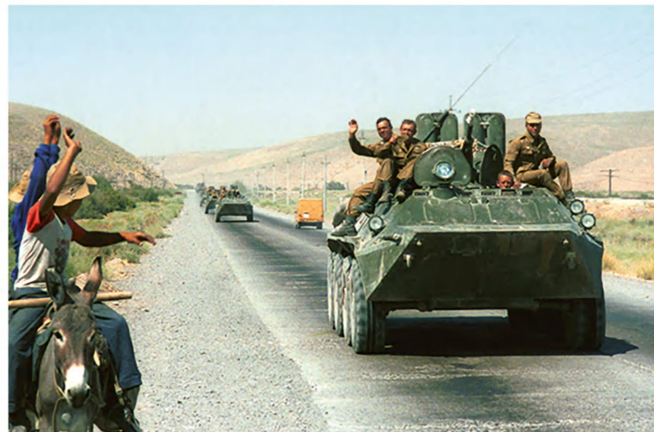
Вывод советских войск из Афганистана.