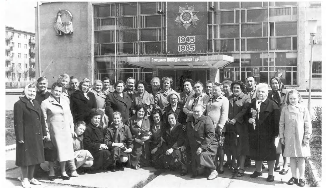
▶ 210-я рота. 1985 год.