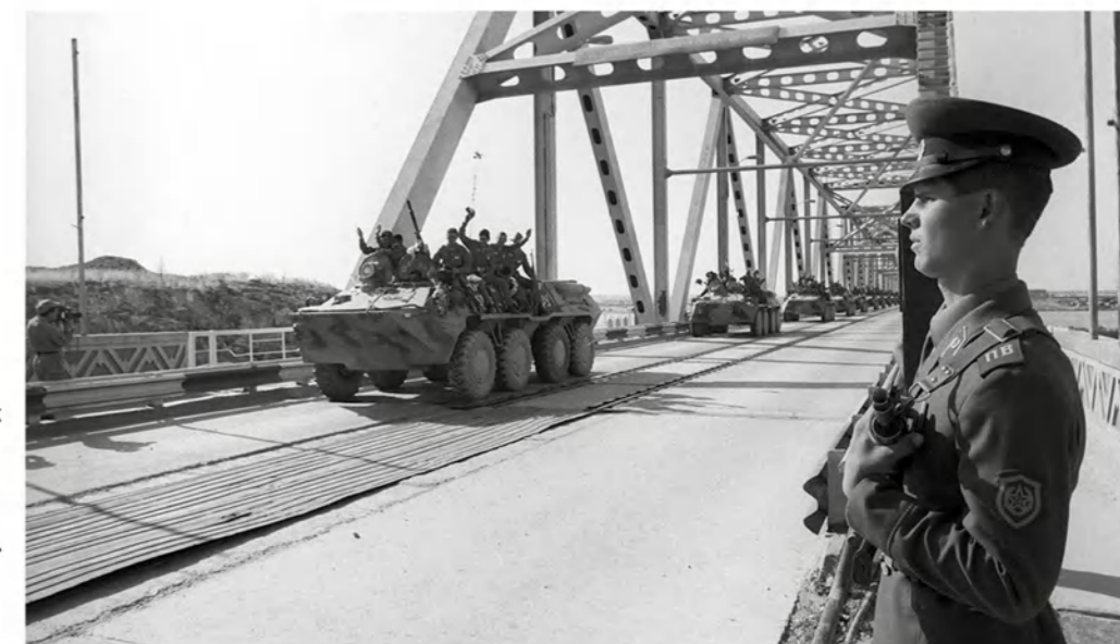
Вывод советских воинов из Афганистана, 15 мая 1988 года.

Р ешение о полном выводе советских войск из Афганистана было принято на заседании Политбюро ЦК КПСС 25 января 1989 года и опубликовано на следующий день с формулировкой: Советский Союз останется верен Женевским соглашениям. После этого в Кабул с визитом прибыл министр обо-