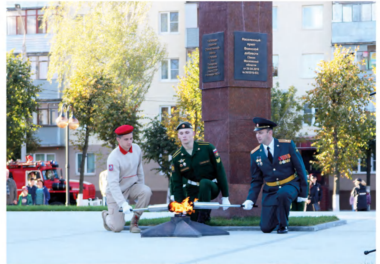
► Сентябрь 2017 года. Торжественная церемония зажжения Вечного огня у стелы «Город воинской доблести».