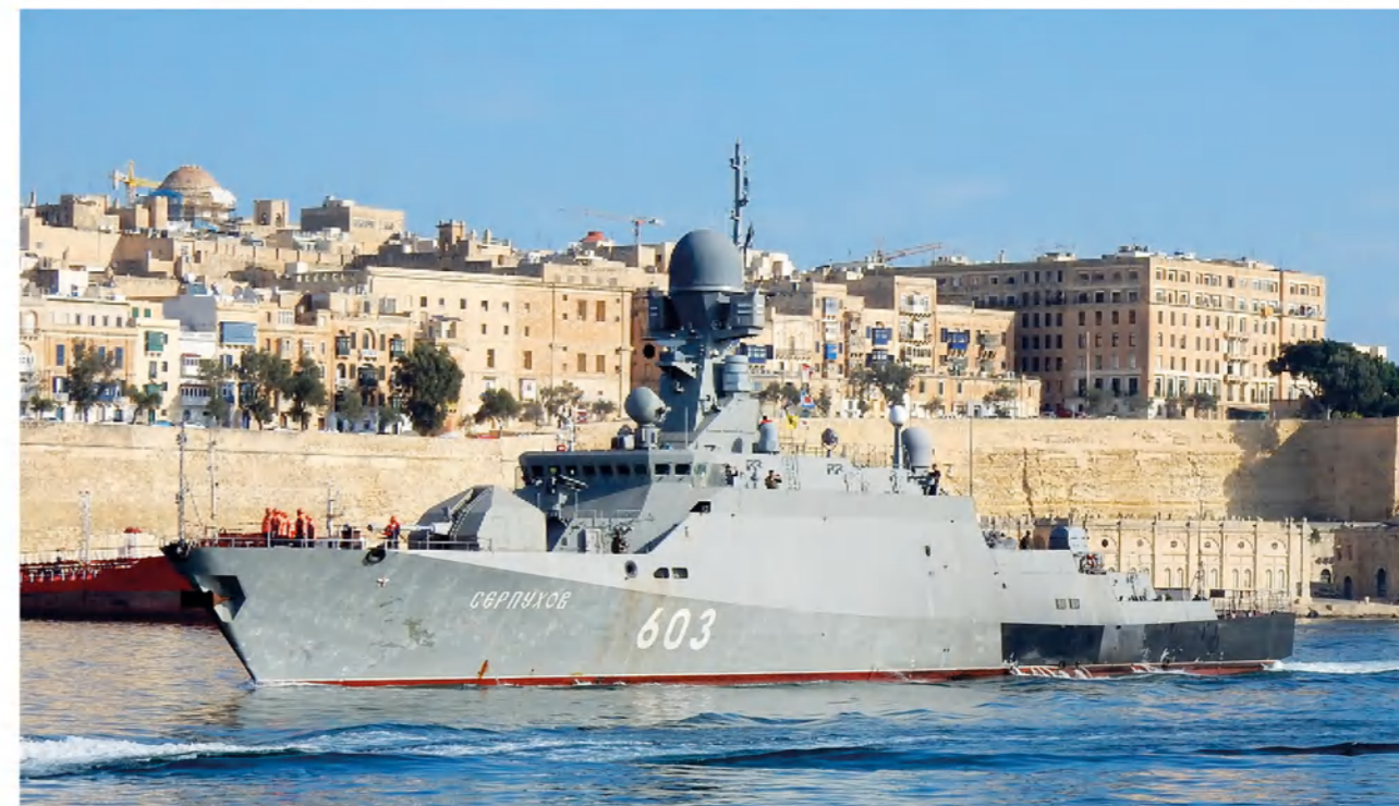
➤ МРК «Серпухов» у берегов Мальты.