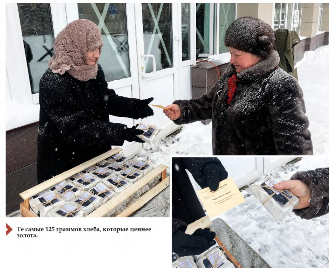
Те самые 125 граммов хлеба, которые ценнее золота.

С ерпуховичи вместе с другими жителями городов нашей страны приняли участие в памятном мероприятии «Блокадный хлеб Ленинграда». Акция проводилась одновременно в трех точках города: в Молодежном центре «Патриот», на Юбилейной и Сенной площадях.