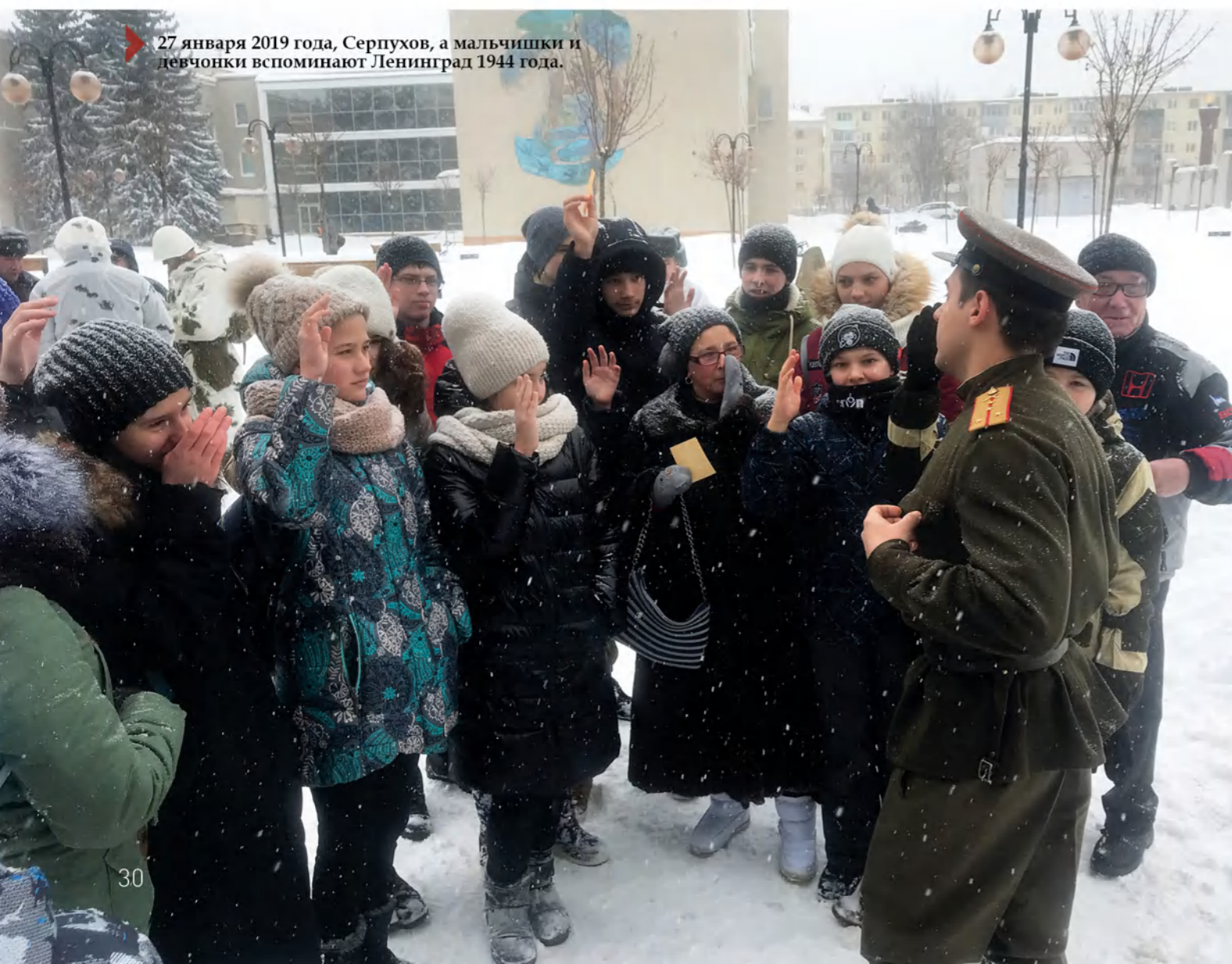
27 января 2019 года, Серпухов, а мальчишки и девчонки вспоминают Ленинград 1944 года.

27 января 1944 года состоялось знаменательное событие для советского народа – День полного освобождения Ленинграда от фашистской блокады. С того самого дня прошло 75 лет, но великий подвиг не забыт.